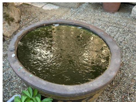
みずかめは氷が張っていた